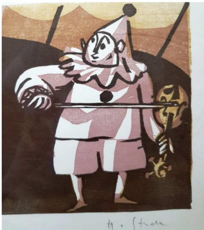
Holzschnitt von Hanns Studer

Dienstag, 16. April 2019, 19.00h Mehrzweckhalle Witterswil