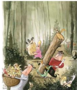
Wir sammeln und pflücken mit Mass