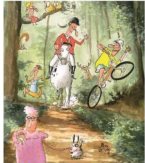
Wir respektieren einander

Den ganzen Wald-Knigge können Sie unter www.waldknigge.ch einsehen und in beliebiger Anzahl bestellen oder herunterladen. Er ist übrigens auch für die Schule geeignet. Mehr Infos zum Wald unter: www.waldschweiz.ch