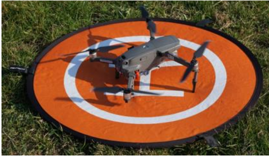
Start- und Landeplatz der Drohne