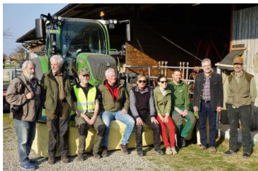
Die Hauptverantwortlichen für die Vorbereitung und Durchführung des eindrucksvollen Anlasses

Achtung: Obwohl diese Vorkehrungen Sinn machen, ist darauf zu achten, dass das Aufgebot frühzeitig erfolgt (Vorbereitung), der Zeitpunkt des Drohneinsatzes vereinbart wird und absolut entscheidend, dass unmittelbar danach das Mähen beginnt, denn in wenigen Stunden verändern sich die Verhältnisse auf den Feldern.