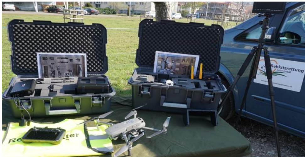
Ausrüstung (Drohne mit Kamera, Steuergerät, Bildschirm und Akkus)

Den Ausführungen des Referenten folgend, sind die eingesetzten Drohnen und Wärmebildkameras nicht spezifisch für diesen Einsatz konzipiert. In einer Flughöhe zwischen 80 und 100 m bewegt sich der Beobachtungswinkel (Sichtfeld der Kamera) bei 50°. Diese technischen Rahmenbedingungen sind dann auch beim Einsatz zu berücksichtigen. Trotzdem erbringen die Geräte erstaunliche Leistungen, die bei der Präsentation beeindruckten. Die Kosten für eine Ausrüstung beläuft sich zwischen Fr. 6'500.— und Fr. 8'500.—.