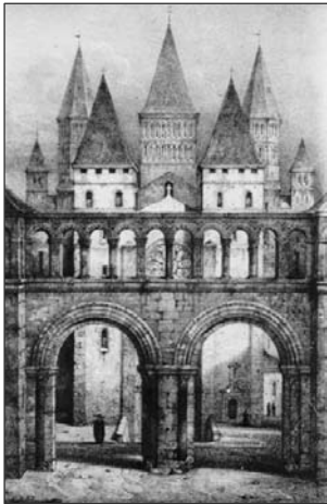
Reste von Cluny nach der Zerstörung (Franz. Revolution)

Preis: Fr. 85.- pro Person/Nacht im Doppelzimmer. Anmeldungen bis Ende April.